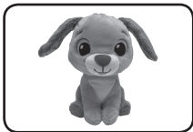
Chien en peluche